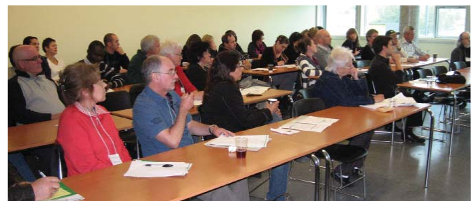
Forum sur l'acceptabilité sociale. Juin 2012.

Le 2 juin dernier, la Chaire Desjardins, en collaboration avec la Chaire de recherche du Canada en foresterie autochtone de l'UQAT, a tenu le Forum sur l'acceptabilité sociale à Rouyn-Noranda. Il paraissait important aux deux chaires d'organiser une journée de discussions et de réflexions sur la conciliation des intérêts économiques et sociaux lors de projets de développement. Les organisateurs dressent un bilan positif de l'événement puisqu'il a permis un avancement de la compréhension de ce qu'est l'acceptabilité sociale. Un autre aspect positif est que le forum a regroupé des acteurs de divers secteurs et horizons. Néanmoins, les grands absents de ce forum étaient certainement les élus. La Chaire remercie les commanditaires de l'événement: le Centre de recherche sur le développement territorial, la Conférence régionale des élus de l'Abitibi-Témiscamingue, l'Agence de la santé et des services sociaux de l'Abitibi-Témiscamingue, l'Université du Québec, la Caisse Desjardins de Rouyn-Noranda, la Fondation de l'UQAT et l'UQAT. ☺