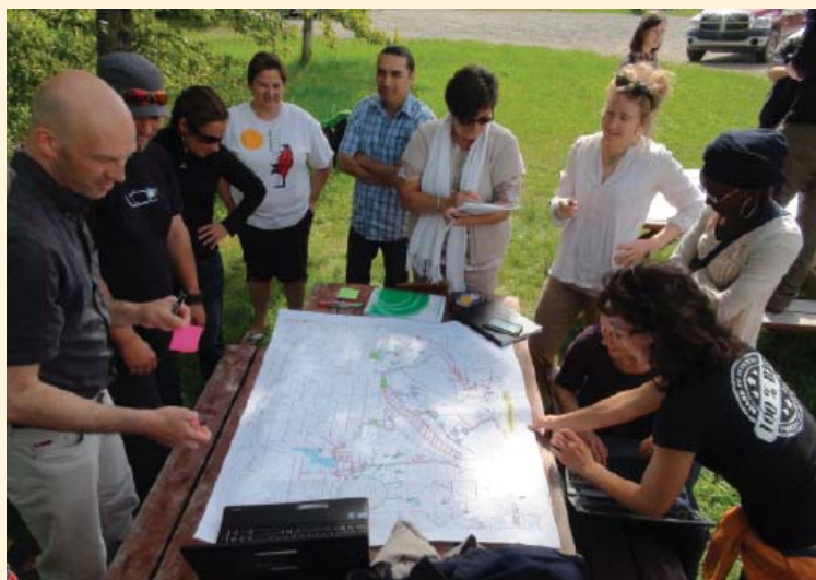
Activité terrain lors de l'école d'été. Mai 2012.

Pour la première fois, la Chaire Desjardins et la Chaire de recherche du Canada en foresterie autochtone de l'UQAT ont organisé conjointement une école d'été du 27 mai au 2 juin. L'école portait sur la gestion intégrée du territoire. Pour l'occasion, 13 étudiants de master d'AgroSup Dijon et d'AgroParisTech - ENGREF Clermont-Ferrand (France) ont séjourné en Abitibi-Témiscamingue. Six autres étudiants inscrits à l'UQAT ont suivi l'ensemble de la formation et quelques auditeurs libres ont participé à une ou plusieurs activités de l'école.