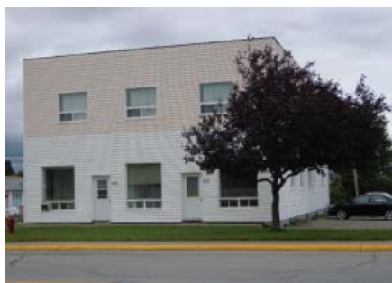
Édifice à logements. Août 2012.

Parmi les faits saillants, l'évaluation globale de la qualité de vie montre que 84% des répondants se sont dits satisfaits de leur qualité de vie. Toutefois, on observe des différences significatives selon les quartiers. Les répondants des quartiers Laval, Nord-Ouest et du Nouveau quartier se disaient satisfaits de leur qualité de vie dans des proportions variant de 93% à 96% comparativement à 79% pour les répondants du quartier des Avenues et de 65% pour les répondants du quartier Centre. Quant aux répondants qui avaient été déménagés lors de la délocalisation, 86,7 % d'entre eux se disaient satisfaits de leur qualité de vie.