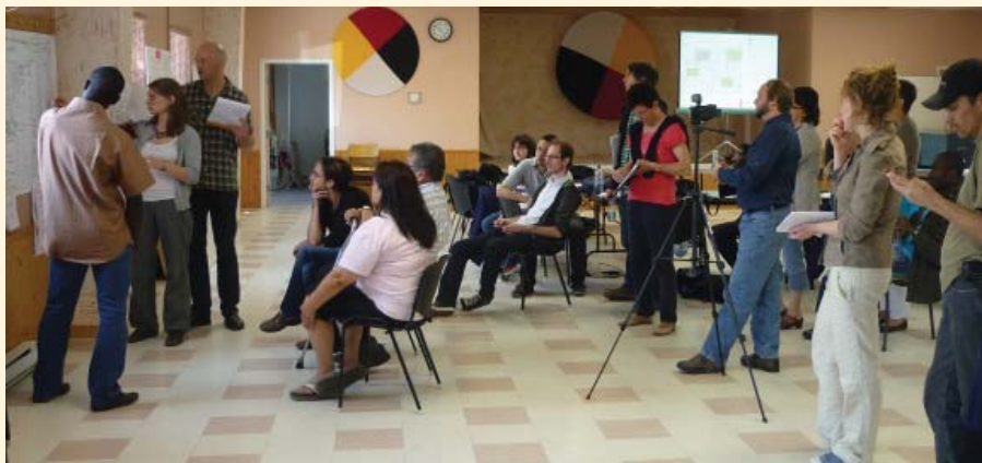
Exercice de restitution lors de l'école d'été. Juin 2012.