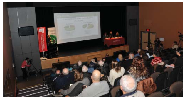
Présentation publique au Théâtre Meglab de Malartic. Octobre 2012.