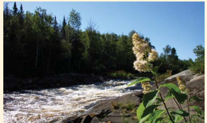
Photo: Vue du sentier pédestre Chute à Grandmaison. 2007.