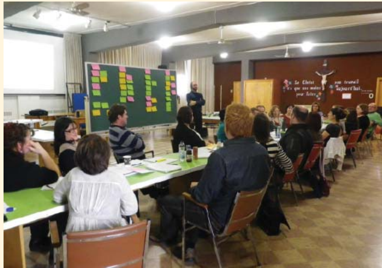
Forum de travail sur le DC. Novembre 2012.

premiers pas et étant lui-même séparé en quatre sous-comités, une rencontre s'avérait nécessaire pour enclencher une démarche de réflexion et d'action entre les membres pour opérationnaliser la priorité DC. Ainsi, l'Agence de la santé et des services sociaux de l'Abitibi-Témiscamingue et la Chaire Desjardins en développement des petites collectivités ont organisé un forum de travail le 7 novembre dernier à Rouyn-Noranda. L'animation était assurée par le directeur de la Chaire, Patrice LeBlanc. Les objectifs de la rencontre étaient : 1. Préciser la finalité du DC (développement des communautés) en région en accord avec les valeurs des participants et de leur organisation; 2. Préciser les façons de faire et les actions qui permettront d'atteindre la finalité; 3. Définir les conditions nécessaires à la réalisation de ces actions et la forme d'engagement pour y arriver (besoins et obligations des intervenants et des organisations, etc.).