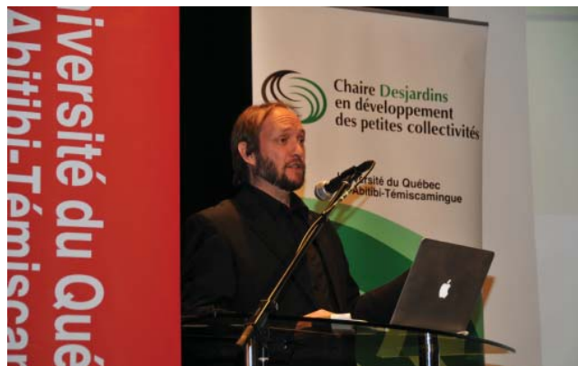
Présentation publique au Théâtre Meglab de Malartic. Octobre 2012.