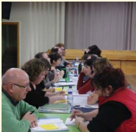
Forum de travail sur le DC. Novembre 2012.