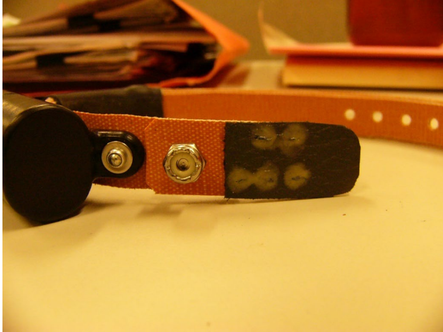
Collier VHF de marque Sirtrack, modifié pour permettre au collier de se détacher avec le temps (env. 2 ans).