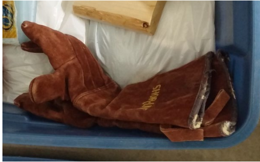
Gants en kevlar