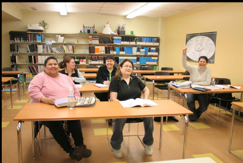
Baccalauréat en Travail Social (Anglais)