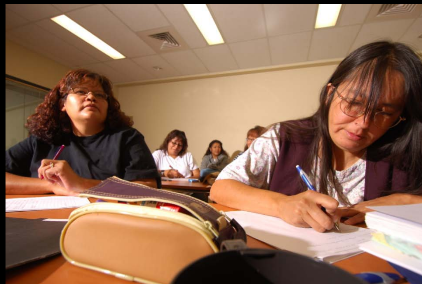
Baccalauréat en éducation préscolaire et en enseignement primaire (Français et anglais)